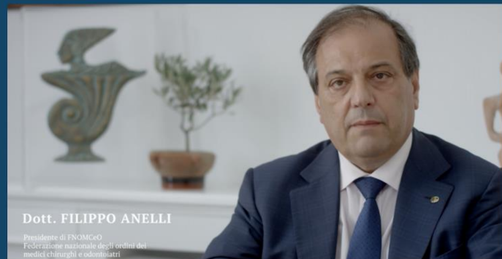
Dott. FILIPPO ANELLI

Presidente di FNOMCeO Federazione nazionale degli ordini dei medici chirurghi e odontoiatri