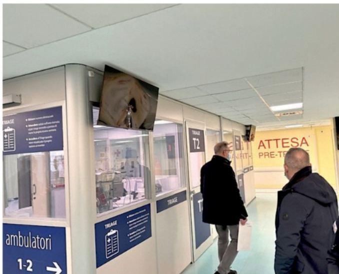
Da sinistra, lo schermo rotto nella sala del Pronto Soccorso: l'uomo nel giro di un quarto d'ora ha messo a ferro e fuoco gli spazi dell'Angelo