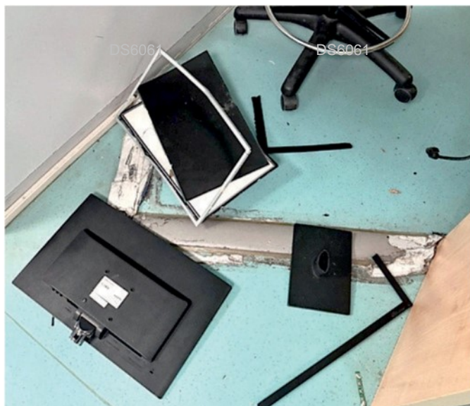
Alcuni monitor scaraventati a terra