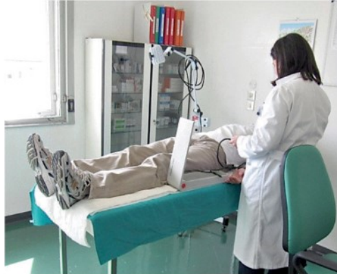
Un ambulatorio medico durante una visita